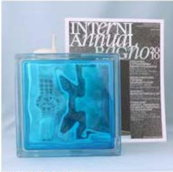
【品番】GL18091 【品名】チェコガラス ディープブル

柄が波状になっているため、少し歪んで映ります。色が濃いのでサンプルは見え辛くなります。