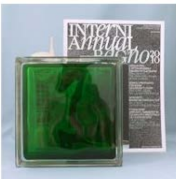
【品番】GL18111 【品名】チェコガラス ディープエメラルド

柄が波状になっているため、少し歪んで映ります。色が濃いのでサンプルは見え辛くなります。