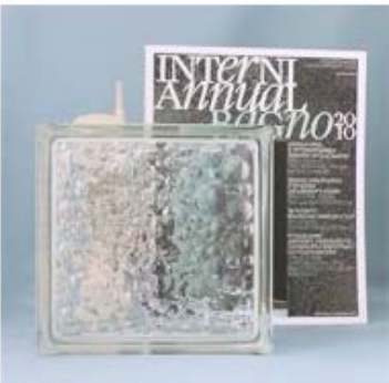
【品番】 GL18041 【品名】チェコガラス サボナ

中面に大小の気泡がランダムに敷き詰められたデザイン。透け感がありますが、サンプルの形を認識することはできません。