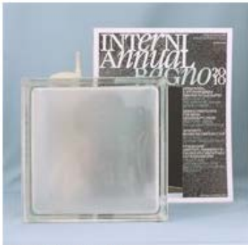
【品番】 GL18031 【品名】チェコガラス サンバ