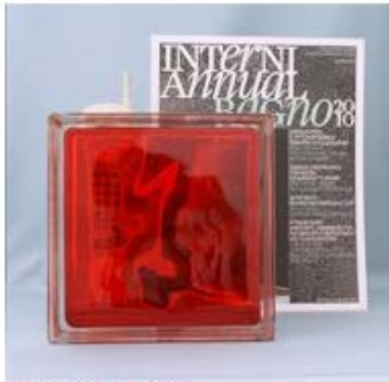
【品番】GL18101 【品名】チェコガラス ディープレッド

柄が波状になっているため、少し歪んで映ります。色が濃いのでサンプルは見え辛くなります。