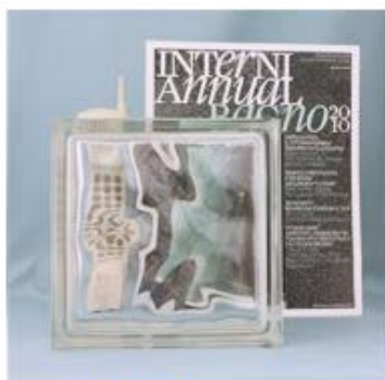
【品番】GL18021 【品名】チェコガラス ウェーブ

表面が波状になったタイプです。面状の特性により歪んで写りますがサンプルは確認できます。