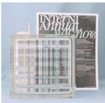
【品番】 GL18051 【品名】チェコガラス クロス

中面に大小の気泡がランダムに敷き詰められたデザイン。透け感がありますが、サンプルの形を認識することはできません。