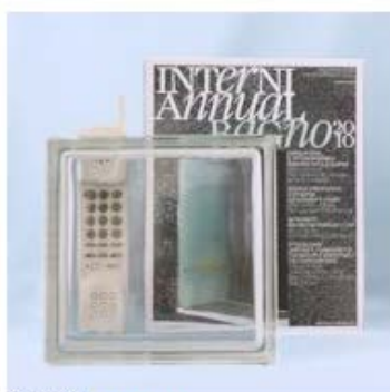
【品番】GL18011 【品名】チェコガラス クリア

チェコガラスの透かし度を比較してみました。 サンプルは電話機の子機と雑誌です。比較しやすいようにガラスブロックとサンプルは5センチほどしか離れていません。ガラス面に細かいパターンが入った物や、色の濃いものほど透かし度は低く(確認しづらく)なります。お部屋の雰囲気に合わせてパターンとカラーをコーディネートして下さい。