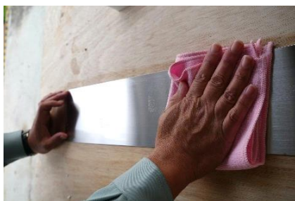
⑥ 乾いた布で乾拭きし、十分に換気している環境下で、自然乾燥させて完了。