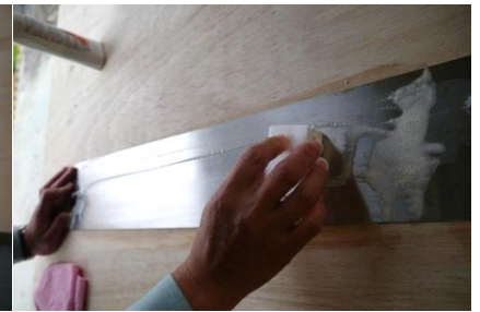
③ 表面をステンレスの目に沿ってこすり、錆を落とす。