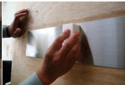
⑤ 水を含んだメラミンスポンジで、水拭きし泡が出なくなるまで繰り返し拭き、クレンザーを完全に拭き取る。3～4回程。(十分に拭き取らないと白く残ります)