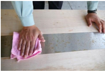
① 水を含んだマイクロファイバークロスで表面の汚れをふき取る。