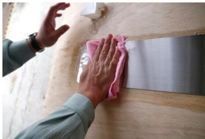
④ 水を含んだマイクロファイバークロスでクレンザー成分をふき取り、錆が取れていることを確認する。