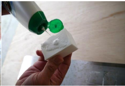
② 水を含んだメラミンスポンジにクリームクレンザーを塗布する。(研磨剤20%以下)